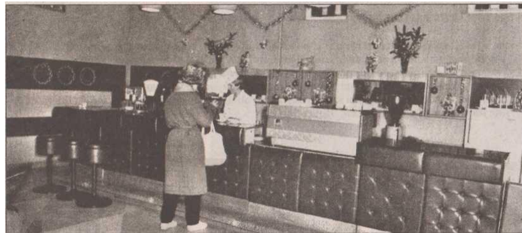
Кафе в универмаге. 70-е гг.

Следующее заведение быстрого питания на улице Советской находилось в доме №23, построенном в 1856 году и известном как дом Ромера. В здании в разные времена размещались отели — «Петербургский»,