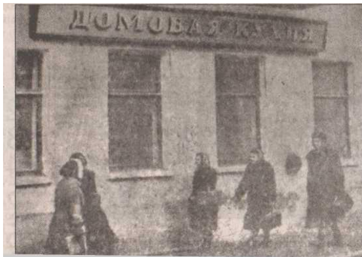
«Домовая кухня». 1962 г.